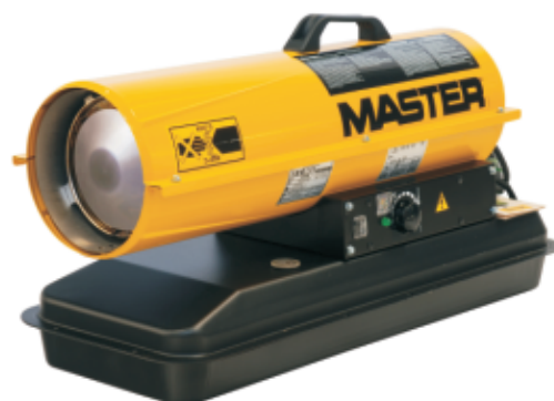
B35CEL - B65CEL

Tato naftová topidla s přímým spalováním nabízí sympatický poměr cena – výkon, motor s tepelnou ochranou a palivové nádrže s ukazatelem stavu paliva. Spalovací komory jsou z nerezové oceli. Tato topidla nejsou vhodná do náročných provozů. Zabudovaný prostorový termostat s displejem.