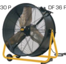
DF 36 P

Tyto profesionální ventilátory nabízejí robustní konstrukci, nastavitelný proud vzduchu, otáčení 360 stupňů a model DF20P nabízí rotaci 360 stupňů horizontálně i vertikálně. Model DF20P můžete pověsit na zeď nebo na strop. Oba modely mají specifický směr proudění vzduchu a najdou využití v různých provozech. Zlepšují proudění a cirkulaci vzduchu.