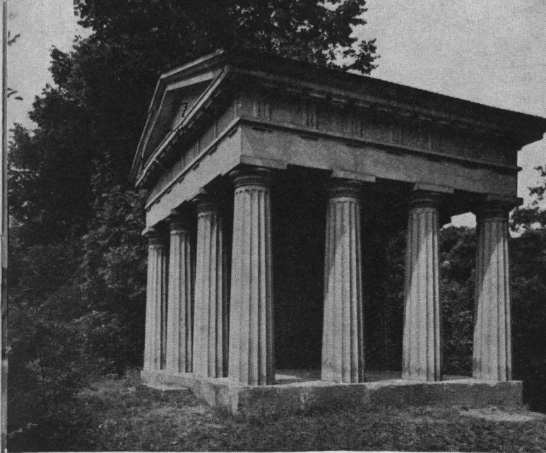
Dórský pavilón v zámeckém parku

Ostatní místnosti nezachovávají původní rozestavení nábytku, najdeme v nich však velmi cenné tapety z 2. poloviny 18. stol., rokokové a klasicistní krby a množství zajímavého materiálu z uměleckého řemesla 18. stol.: soubor míšeňského porcelánu, holandské tapiserie, nábytek zdobený bohatými intarziemi. V obrazové výzdobě převládají portréty rodiny Chotků. Dnešní stav zámku je výsledkem restauračních prací, které zde probíhaly v letech 1956—1957. Tehdy byla pod empírovou výmalbou odkryta rokoková výzdoba stěn v loveckém sále a v tzv. jídelně objevena nástropní malba z poloviny 18. stol. — scéna „Judita a Holofernes“.