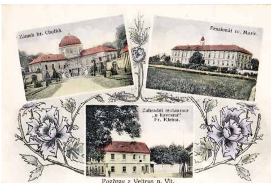
POHLEDNICE KOLEM ROKU 1918 S LEŠENÍM U NOVÉHO VZORKU BAROKNÍ NADOKENNÍ ŘÍMSY