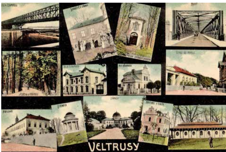
POHLEDNICE KOLEM ROKU 1908 S MĚSTSKOU I ZÁMECKOU ARCHITEKTUROU, RUČNĚ KOLOROVÁNO