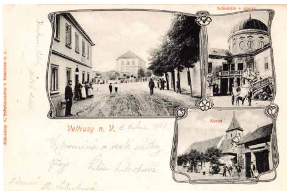
SVĚTLITISKOVÁ POHLEDNICE Z ROKU 1903