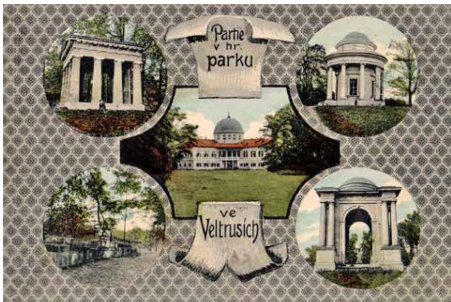
POHLEDNICE ZÁMKU A PARKU Z ROKU 1916 – RUČNĚ KOLOROVANÝ SVĚTLTIK