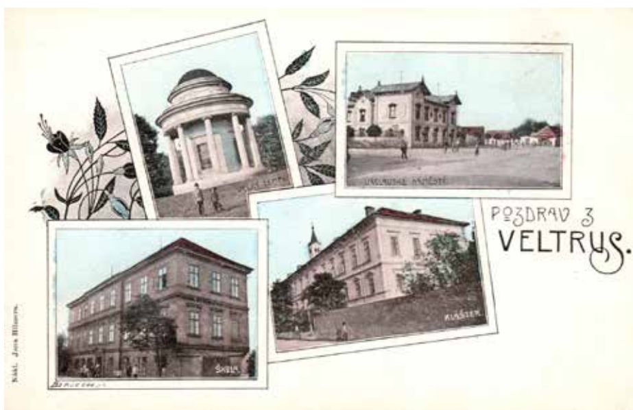
RUČNĚ KOLOROVANÁ POHLEDNICE Z 1906 S VILOU FERDINANDIOVÝCH, ŠKOLOU A KLÁŠTEREM