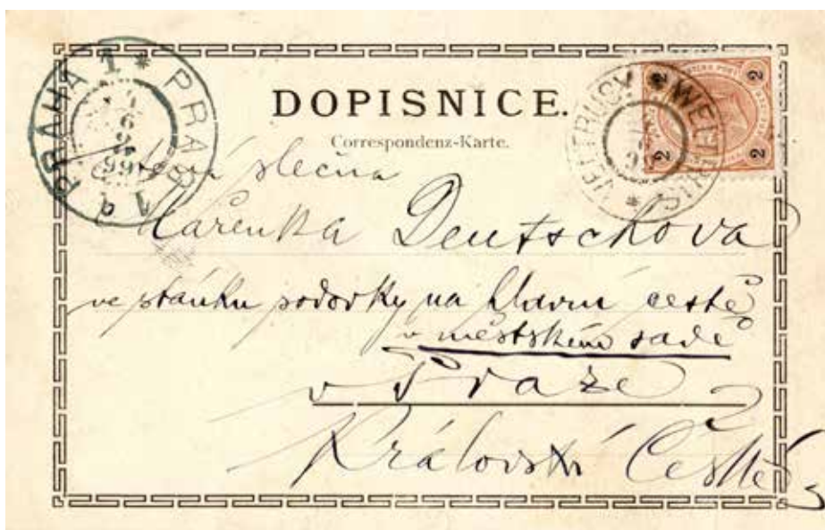
KOUZELNÉ OSLOVENÍ NA ZADNÍ STRANĚ POHLEDNICE Z ROKU 1899, A POHLED DOŠEL!