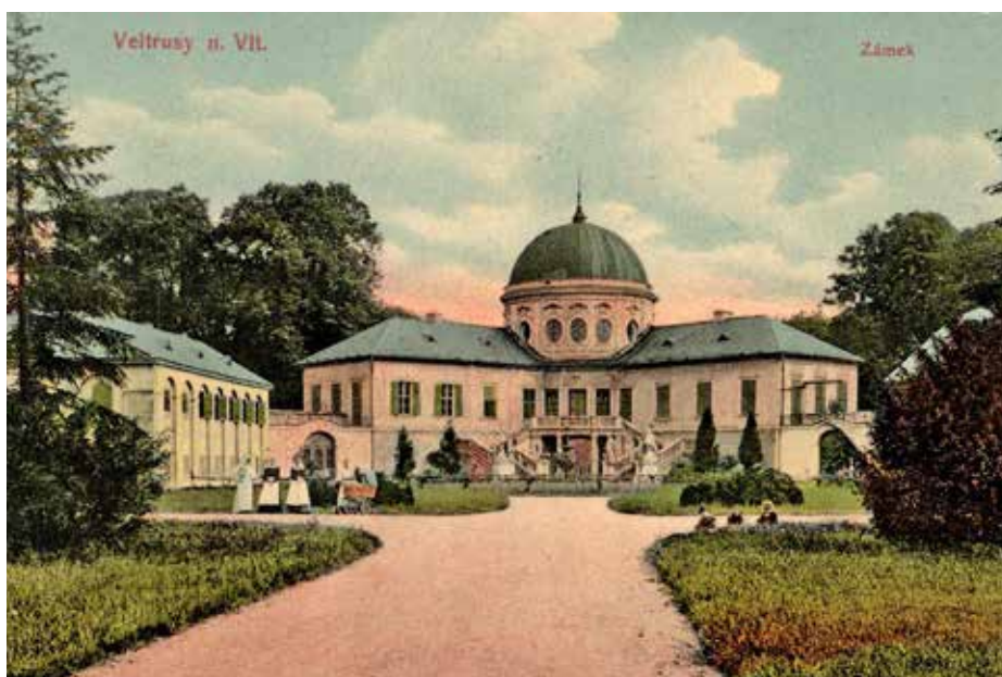
PLNOBAREVNÁ POHLEDNICE ZÁMKU SE SLUŽEBNICTVEM KOLEM ROKU 1908