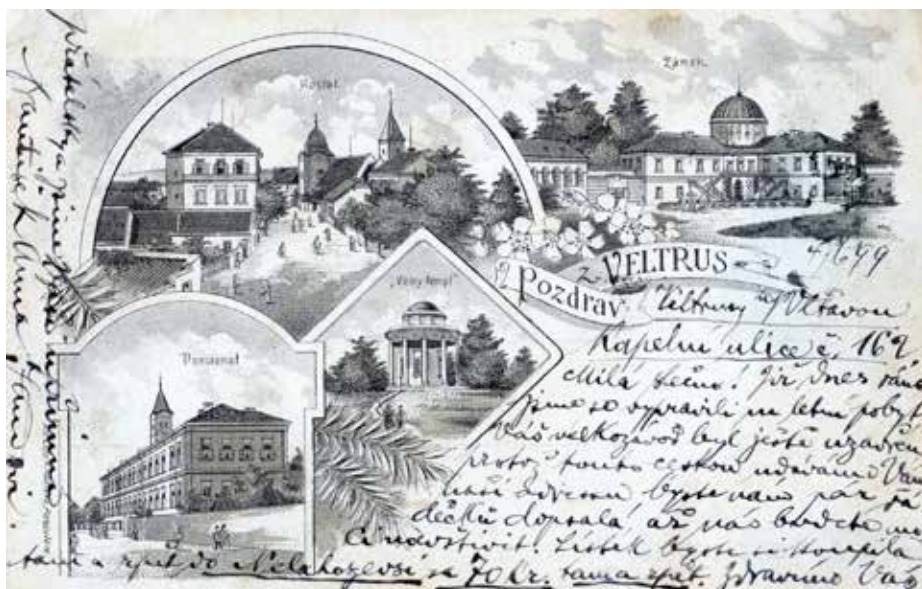
POHLEDNICE Z ROKU 1899 S PŮVODNÍ PODOBOU KOSTELA NAROZENÍ SV. JANA KŘTITELE