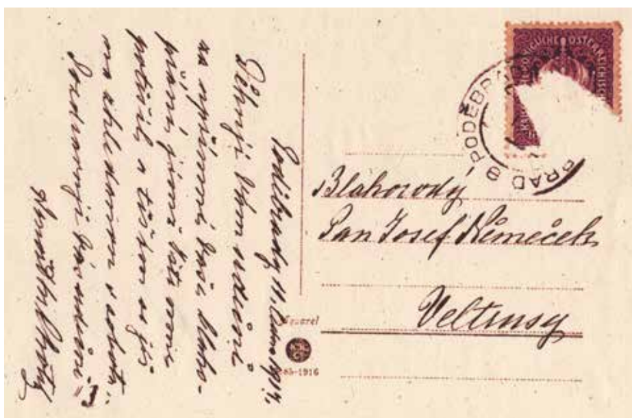
ZADNÍ STRANA POHLEDNICE OD HRABĚTE ARNOŠTA CHOTKA SVĚMU KOMORNÍKOVÍ