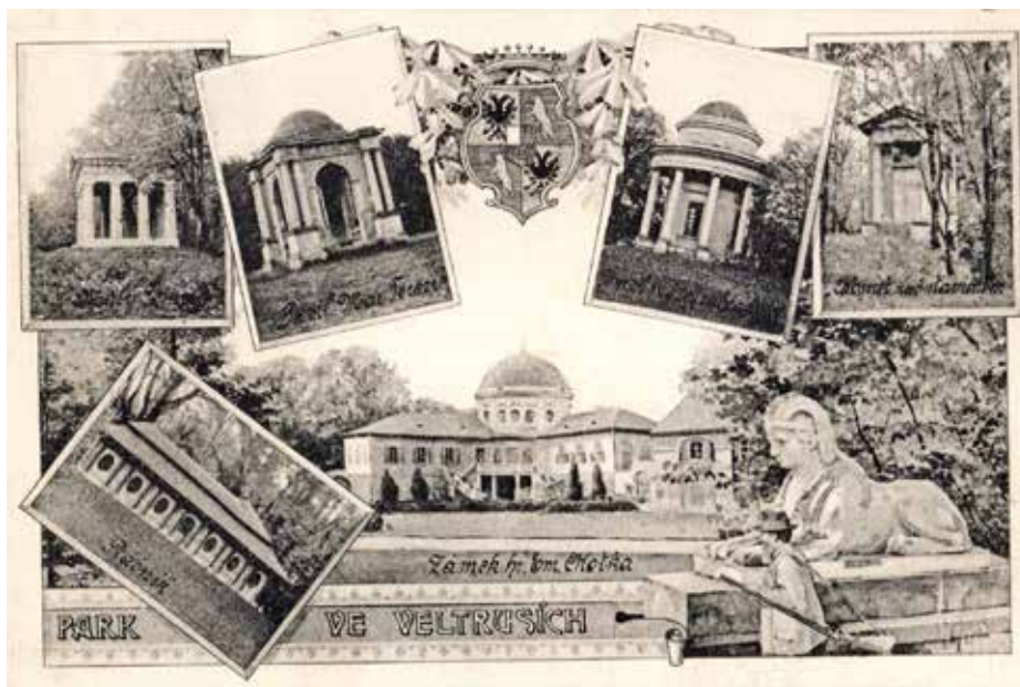
POHLEDNICE Z ROKU 1906 SE ZÁMKEM, PARKOVOU ARCHITEKTUROU A HAJNÝM