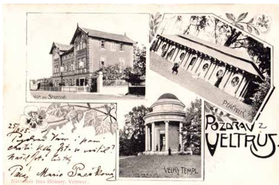
POHLEDNICE NÁKLADEM JANA HILMERY Z VELTRUS Z ROKU 1906 S ČÍNSKOU BAŽANTNICÍ