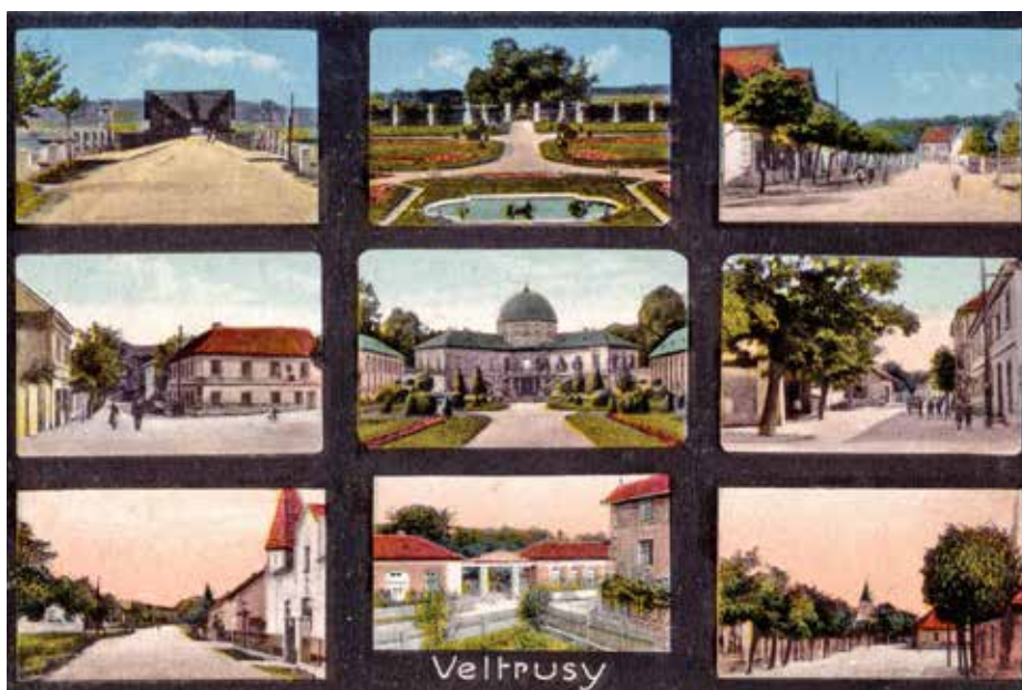
DEVÍTIKÉNKOVÁ POHLEDNICE Z DVACÁTÝCH LET 20. STOLETÍ, RUČNĚ KOLOROVÁNO