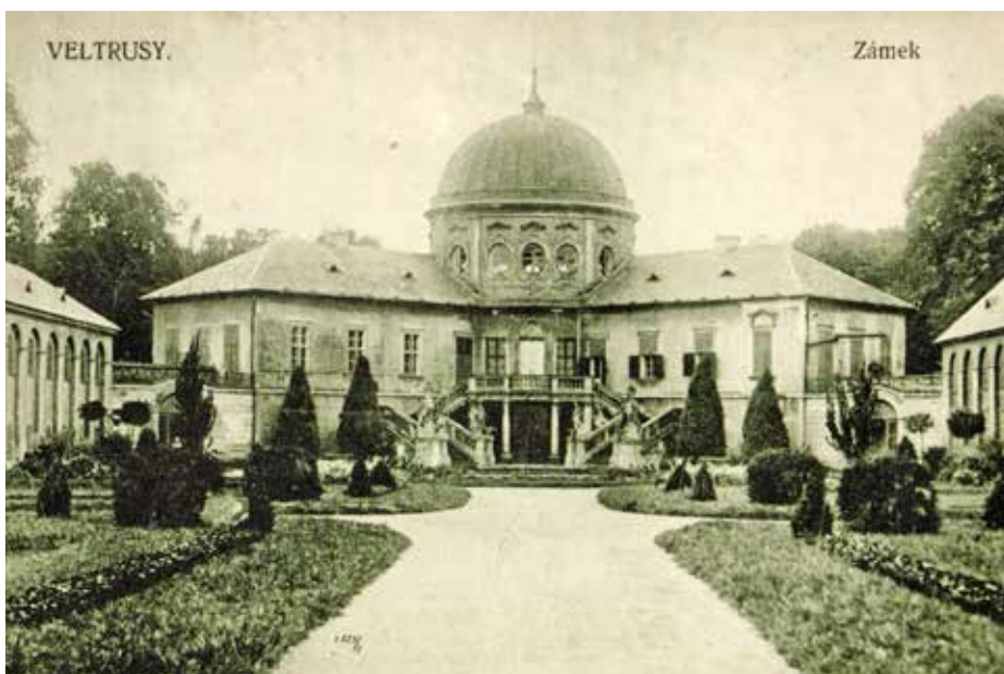
ZAHRADNÍ ÚPRAVA ČESTNÉHO DVORA ZÁMKU VELTRUSY NA POHLEDNICI KOLEM ROKU 1918

zásilkou pečlivě uzavřeny a utajeny před veřejností v zalepené obálce, dokonce i s pečeti!