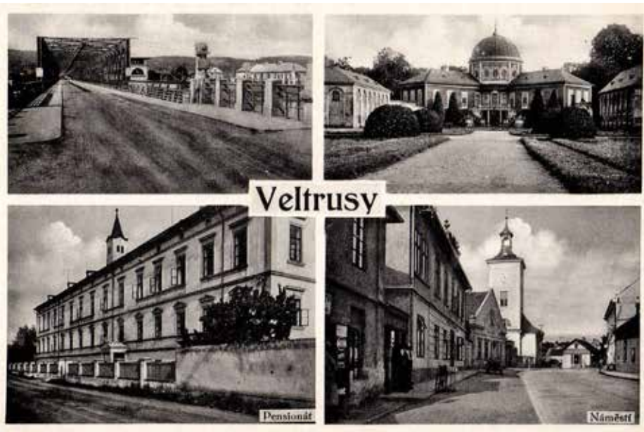
FOTOGRAFICKÁ POHLEDNICE Z TŘICÁTÝCH LET 20. STOLETÍ

← PODPISY SOVĚTSKÝCH VOJÁKŮ NA POHLEDNICI Z VELTRUSY 10. 5. 1945