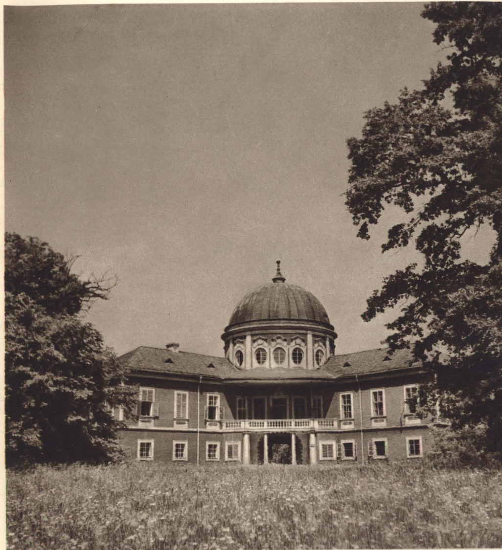
Pohled na zámek z parku

Z dalších místností prvního patra, rovněž upravených většinou v téže době,