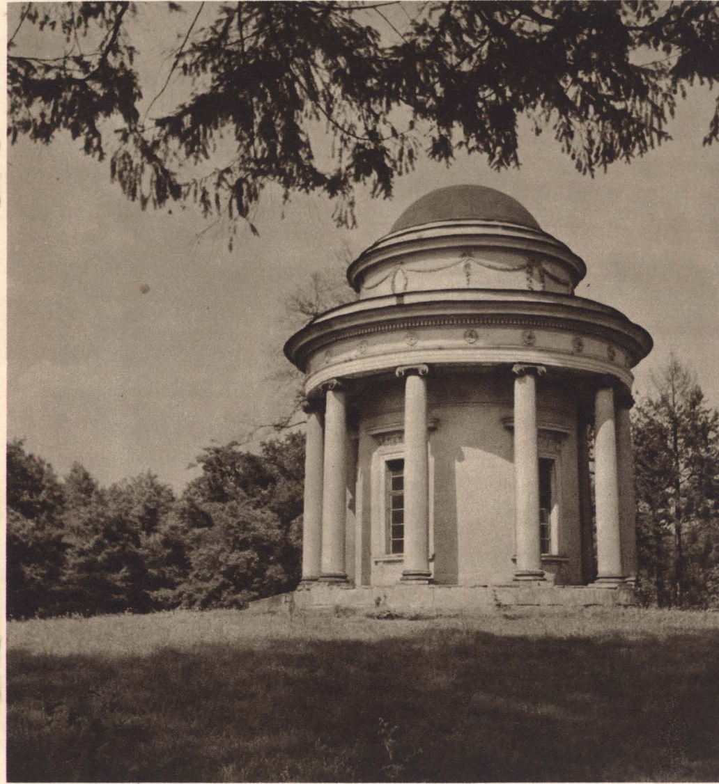
Chrámek přátel venkova a zahrad