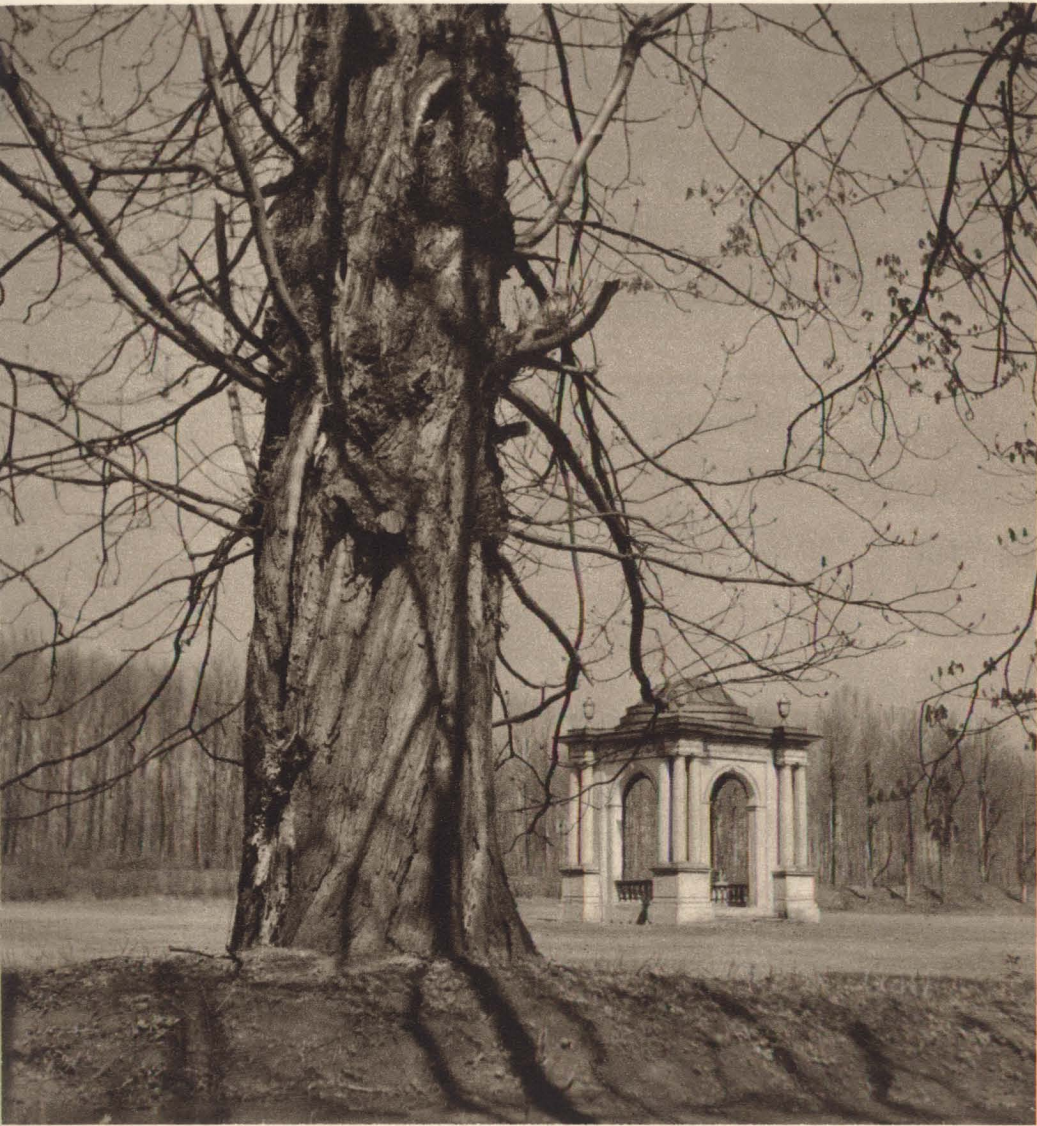
Pavilon Marie Terezie