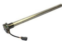
SNÍMAČE HLADINY PALIVA