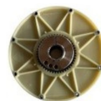
SPOJKY A OZUBENÉ KOLESÁ