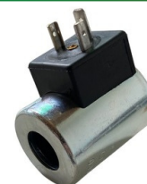
MAGNETICKÁ CIEVKA 24VDC 1,0A 13,4Ω