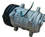
AC KOMPRESOR 504107 KOMATSU/VALMET