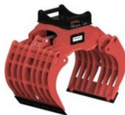
DGS-KLIEŠTE NA KAMEŇ A RECYKLÁCIU