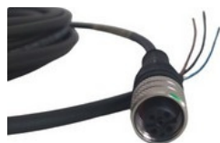
KONEKTORY PRE SENZORY S KÁBLOM