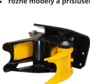
ZREZÁVACIA HLAVA TMK 150