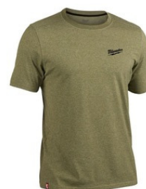
TRIČKÁ, MIKINY, ŠILTOVKY, ČIAPKY