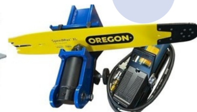
VYROVNÁVAČ VODIACICH LÍŠT- PNEUMATICKÝ