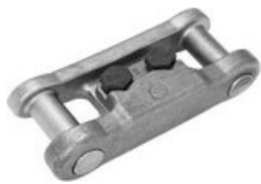
SPOJOVACIE ČLÁNKY NA KOLOPÁSY