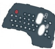
GUMENÉ TLAČÍTKA A PALETY