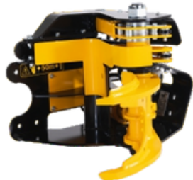
ZREZÁVACIA HLAVA TMK S KOLEKTOROM A ODVETVOVAČOM