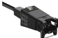
KONEKTORY PRE PROPORCIONÁLNU CIEVKA