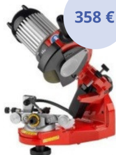
BRÚSKA NA REŤAZE SUPER JOLLY