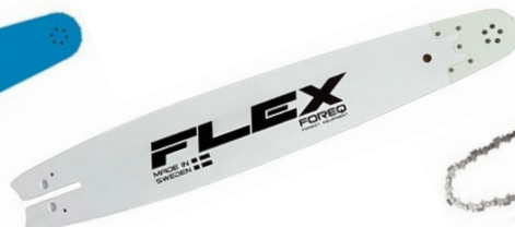
VODIACE LIŠTY FLEX