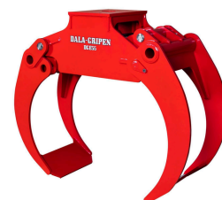
DGE-KLIEŠTE VIACÚČELOVÉ VYUŽITIE