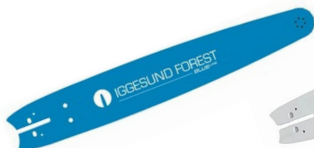
VODIACE LIŠTY IGGESUND