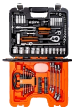
RÔZNE SADY NÁSTRČNÝCH A KOMBINOVANÝCH KLÚČOV