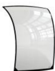
OKNÁ NA KABÍNY