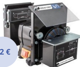
BRÚSKA VODIACICH LÍŠT A VODIACICH ČLÁNKOV