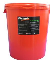
DIVINOL TOP FETT 2003 25KG