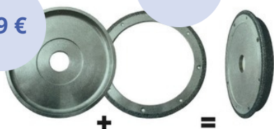
DIAMANTOVÝ NOSNÝ DISK A BRÚSNY KOTÚČ