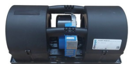
VENTILÁTOR F073758 JOHN DEERE/TIMBERJACK