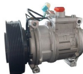
AC KOMPRESOR AT172975 JOHN DEERE/TIMBERJACK