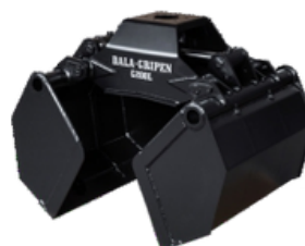
G-KLIEŠTE NA SYPKÝ MATERIÁL/PÔDU