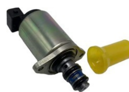
PROPORCIONÁLNA CIEVKA PVC25 24V