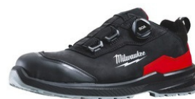
PRACOVNÁ OBUV MILWAUKEE