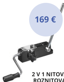
2 V 1 NITOVAČKA S ROZNITOVAČKOU