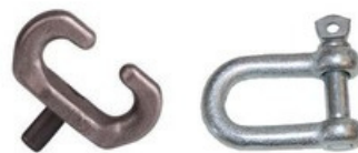
SPOJOVACÍ ČLÁNOK S NATLKAČÍM TRŇOM A SPOJOVACÍ TRMEŇ