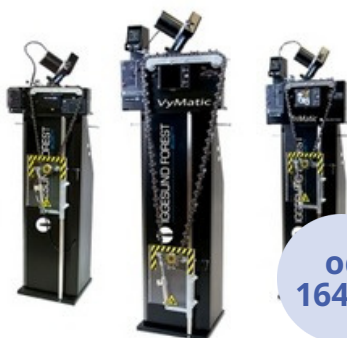
AUTOMATICKÉ BRÚSKY REŤAZÍ