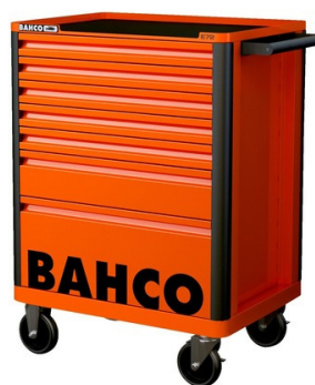
VOZÍKY NA NÁRADIE