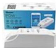
Meranie spotreby el. energie 16A