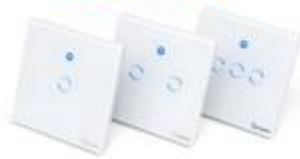
dotykový vypínač 1-2-3 gang