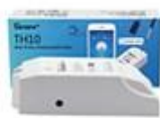
Meranie teploty a vlhkosti 10A - 16A