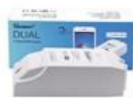
Ovládanie 2 zariadení 16A