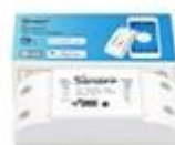
Smart BASIC alebo RF diaľkové ovládanie