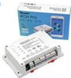
Ovládanie 4 zariadení DIN lišta 3-módy