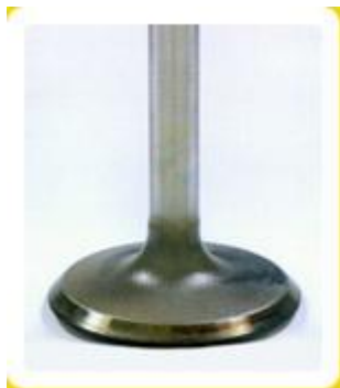
Ventil po použití BG