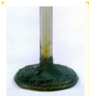
Ventil před použitím BG