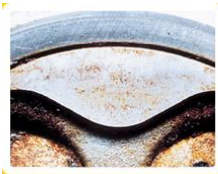
Spalovací prostor po použití BG