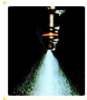
Vstřík po použití BG

Ventily – Produkty BG byly vždy světovou jedničkou v odstraňování karbonových úsad z ventilů. Úsady na ventilech a dosedacích plochách ventilů výrazně ovlivňují výkon, spotřebu motoru a zapříčiňují "klapání" motoru. Nové složení BG přípravků zvýšilo jejich účinnost o dalších 18 %. BG 245 navrácí motoru plný výkon, snižuje spotřebu a speciální syntetická látka vytváří polituru na ventilech, která oddaluje novou tvorbu karbonových úsad.