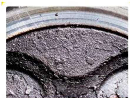
Spalovací prostor před použitím BG