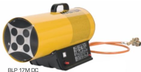
BLP 17 M DC

Tato plynová topidla s ručním piezo zapalováním umožňují provoz topidla zcela nezávisle na napájecí elektrické síti po dobu delší než 8 hodin. Lithiovou 3 Ah / 14,4 V baterií lze od topidla snadno odpojit a dobít. Provoz je možný i standardní cestou pomocí elektrického síťového adaptéru. Baterie je kompatibilní s akku BOSCH 14,4V příslušné řady.